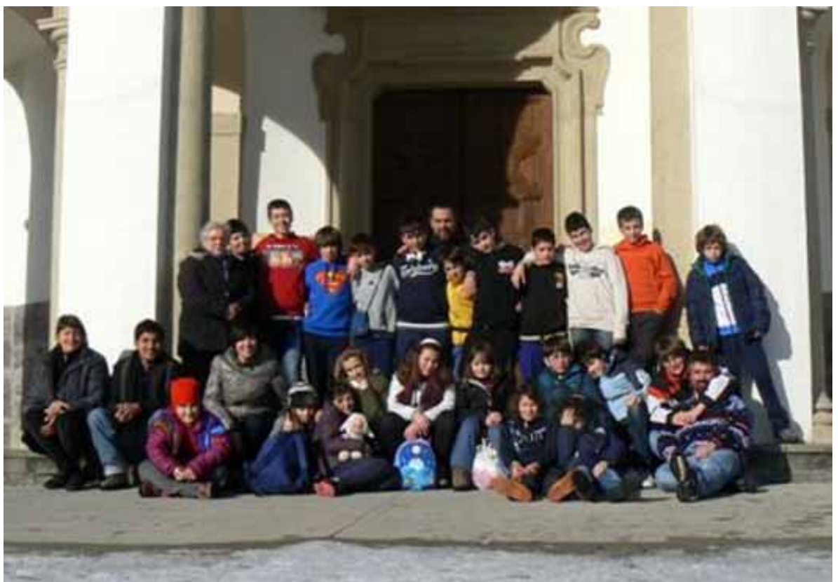
Bueggio 2012: un'esperienza sempre speciale!