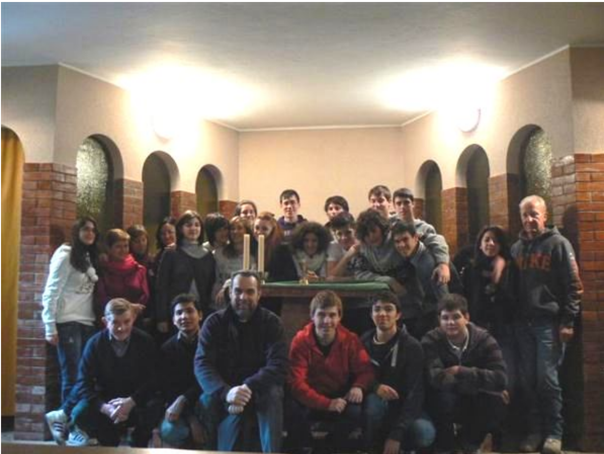
Fai della paganella 2012: giorni indimenticabili di amicizia, fede, sports invernali con l'Oratorio MMdC.