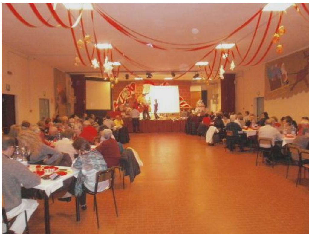
Capodanno a MMdC