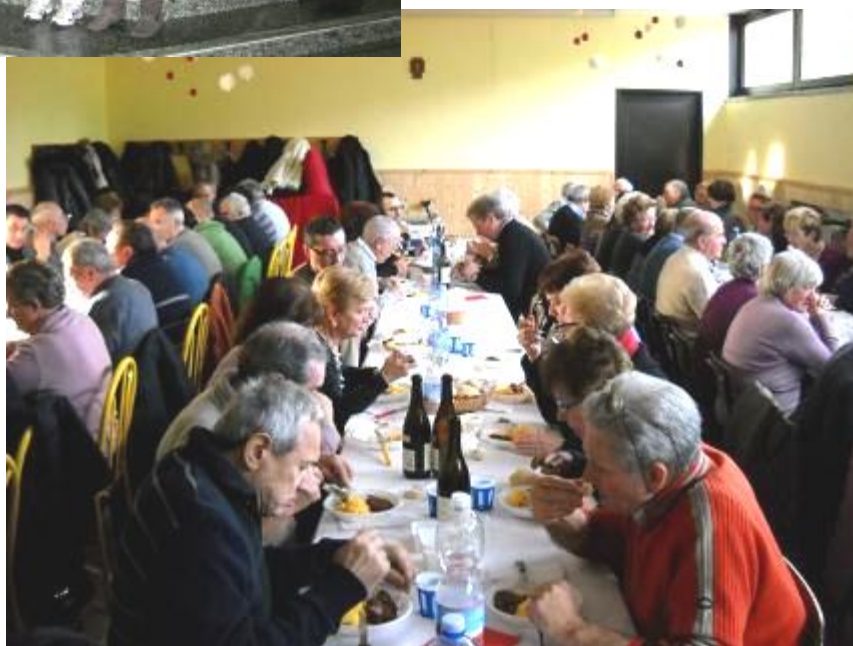
Il pranzo di Natale pro S. Anna: cordiale amicizia ed ottima cucina!