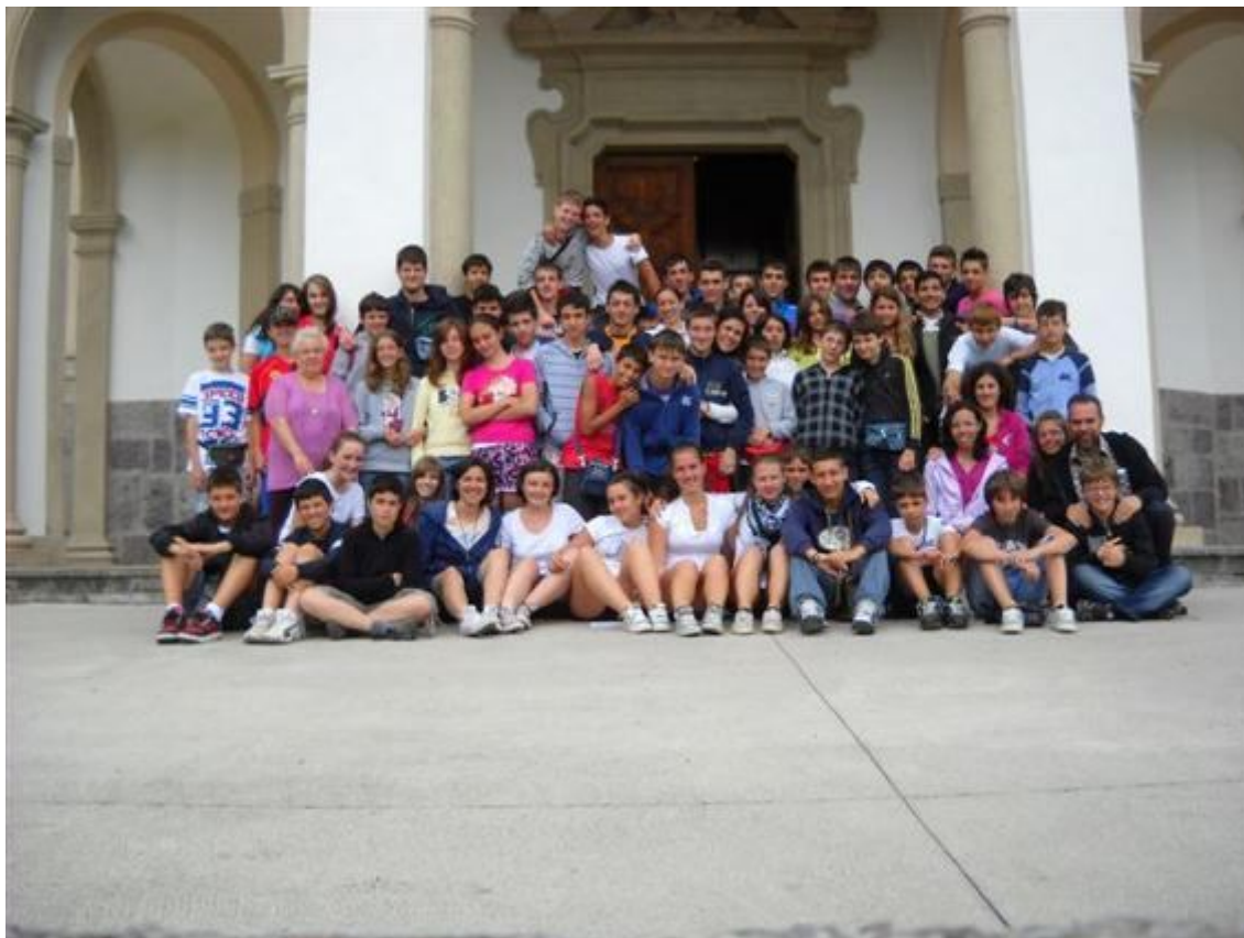
Estate 2011: i nostri ragazzi a Bueggio. Due turni di vacanza indimenticabili!