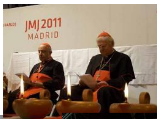
il 25 per al nuovo Angelo.