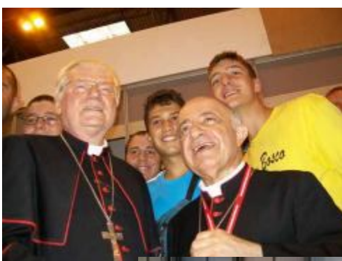
Tettamanzi e il benvenuto arcivescovo