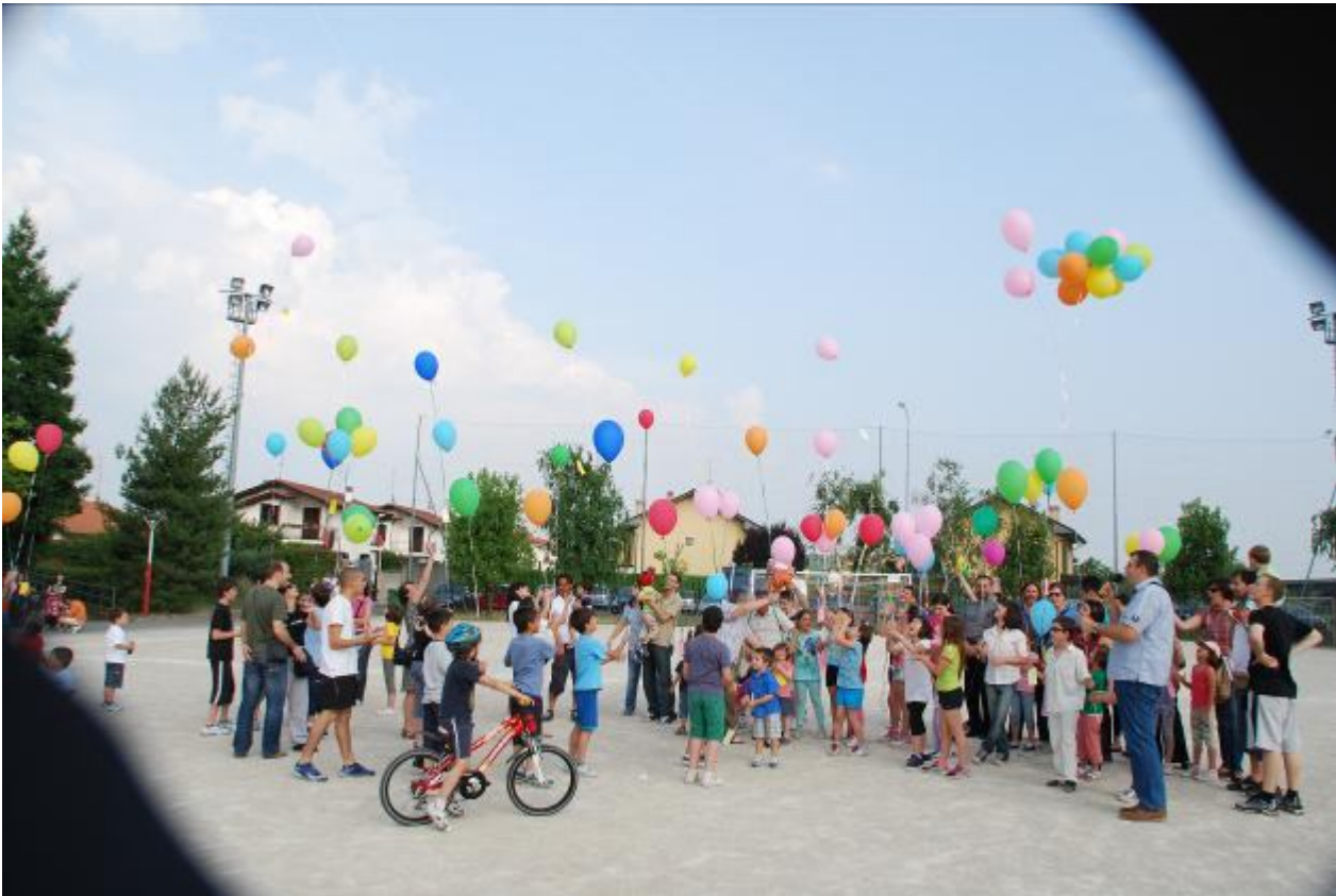
Pronto per il tradizionale lancio dei palloncini