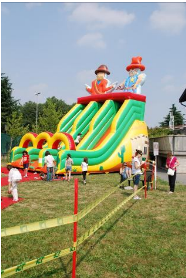
Potevano forse mancare i divertentissimi gonfiabili?